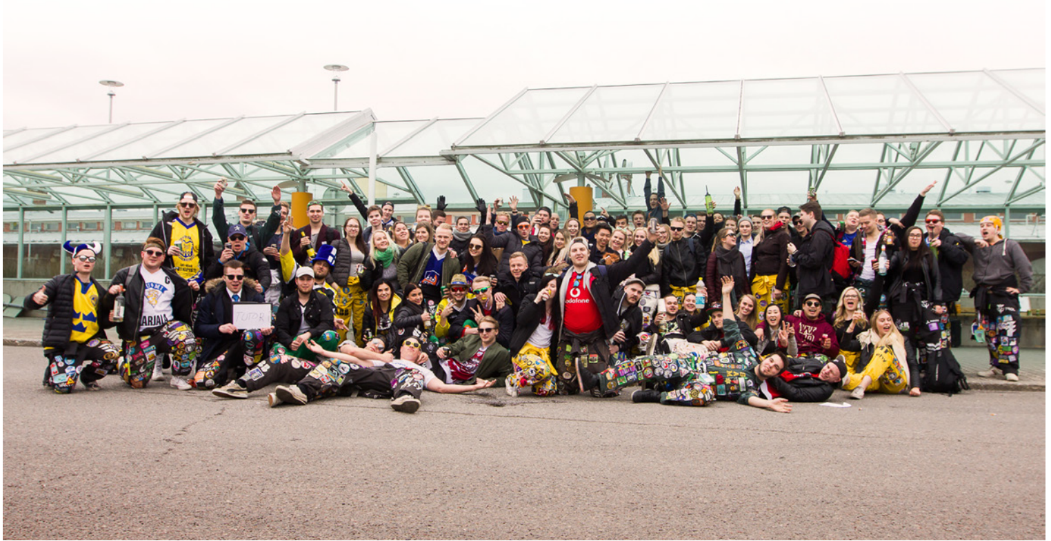
2017 Tutorporukka lähdössä perinteiselle tutor-risteilylle pitämään hauskaa.