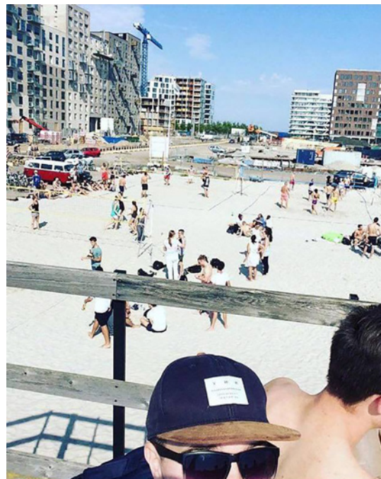
Selfie kaupungin rannasta