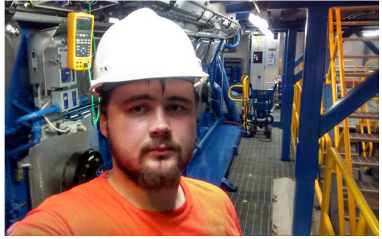
Minä ja Wärtsilä 18V50SG

” Kaikkein pahimman hellejakson aikana päivän korkein lämpötila nousi yli 37 asteeseen kahden viikon ajan.”