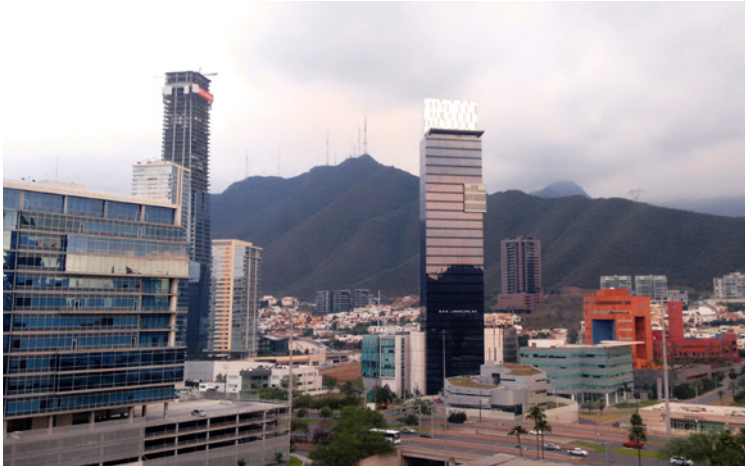
Näkymä hotelliin parvekkeelta