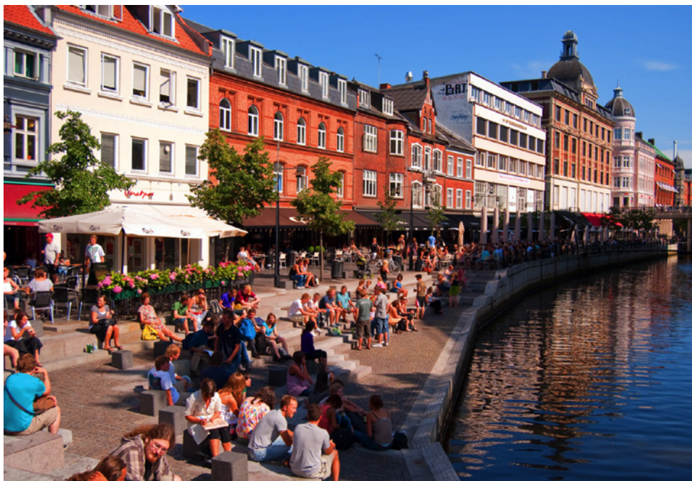
Keskustaa jakaa joki