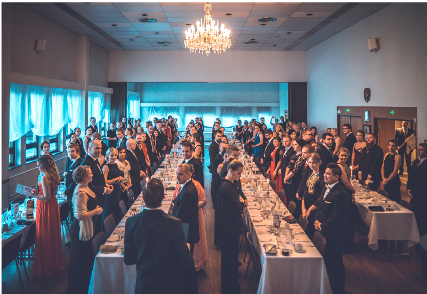
Tunnelmaa, kuohuvaa, puheita ja juhlavieraita vuoden 2017 vuosijuhlilla.

Vuosijuhlat koostuvat muun muassa loistavasta juhlatunnelmasta, kolmen ruokalajin illallisesta, laulamisesta, juhlapuheista ja tietenkin ihanista iltapuvuista ja kampauksista tai vastaavasti komeista puvuista ja kiiltävistä kengistä. Itse Vuosijuhlien jälkeen on luvassa jatkot Leipätehtaalla, joten juhlinta jatkuu aamuun asti! Vuosijuhlien jälkeinen päivä vietetään Silliksen eli "silliamiaisen" merkeissä ja sehän tarkoittaakin sitä, että kerrankin saa tulla valmiiseen pöytään nauttimaan krapparuoasta ja tietenkin loistavasta seurasta! Koko kokonaisuus kuulostaa houkuttevalta, eikö vain?