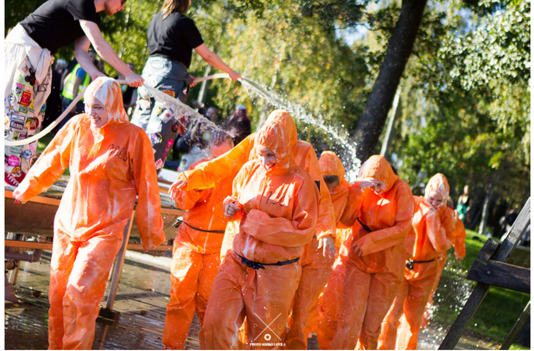
VAMOK järjestää vuosittain syyskuussa uusille opiskelijoille kastajaiset, jotka kulkevat nimellä Olutpialaiset.