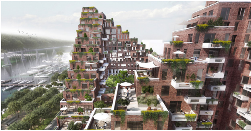
Sataman kuuluisat asunnot

Mikäli vaihto jäi kiinnostamaan, siitä saa lisätietoa ensimmäisen vuoden opiskelijoille järjestettävistä kv-infoista, kaksi kertaa vuodessa järjestettävistä Go abroad-vaihtoinfoista, koulun Portaalista "Vaihto-opiskelu –Exchange abroad" kohdasta tai käymällä kv-toimistossa kv-koordinaattorin juttusilla.