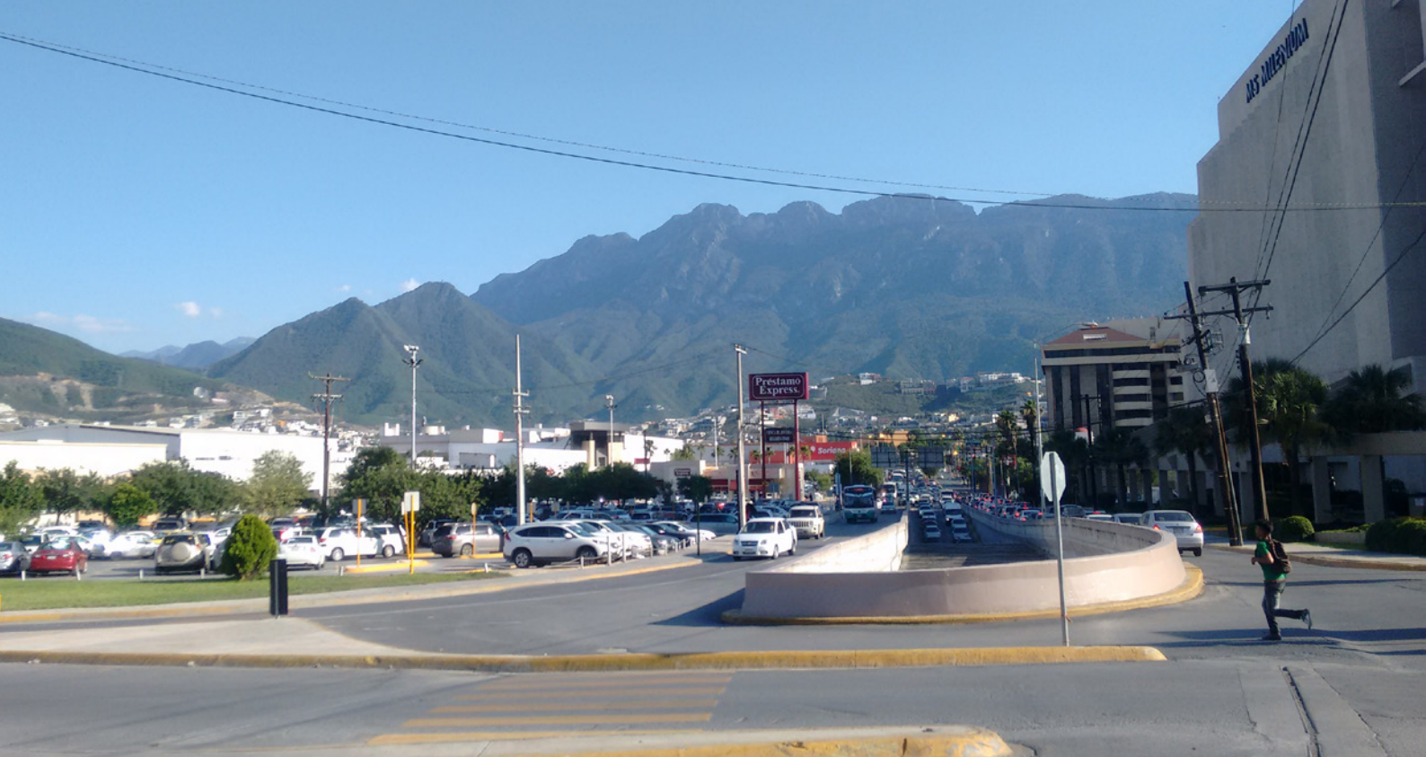
Asuinalueella oli näyttävät maisemat.

ajan. Hellejakson jälkeinen vesisade tuntui suorastaan pirstävän erilaiselta.